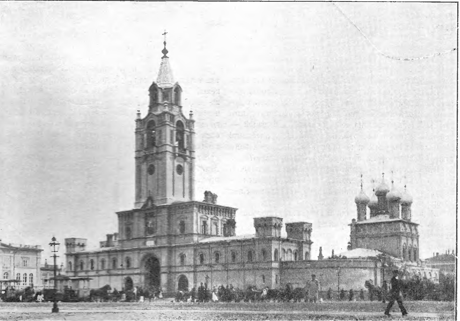
Виды г. Москвы. — Страстной монастырь.

„Русскій Паломникъ“ одобренъ всеми вѣдомствами.