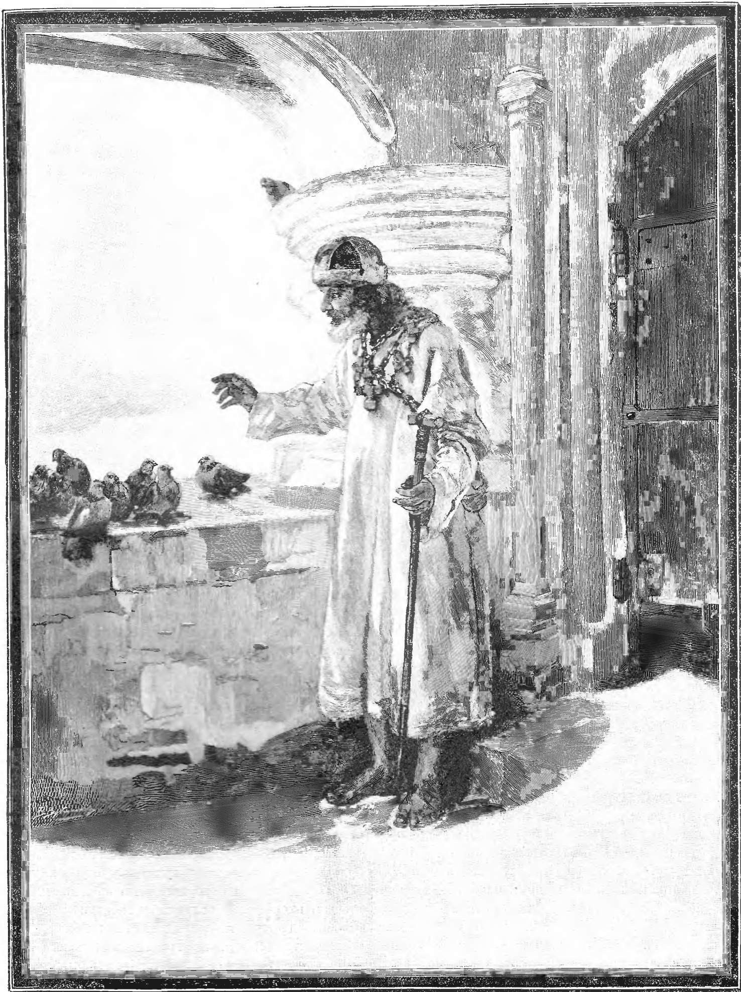
Б л а ж е н н ы й, (Съ картины Лебедева).