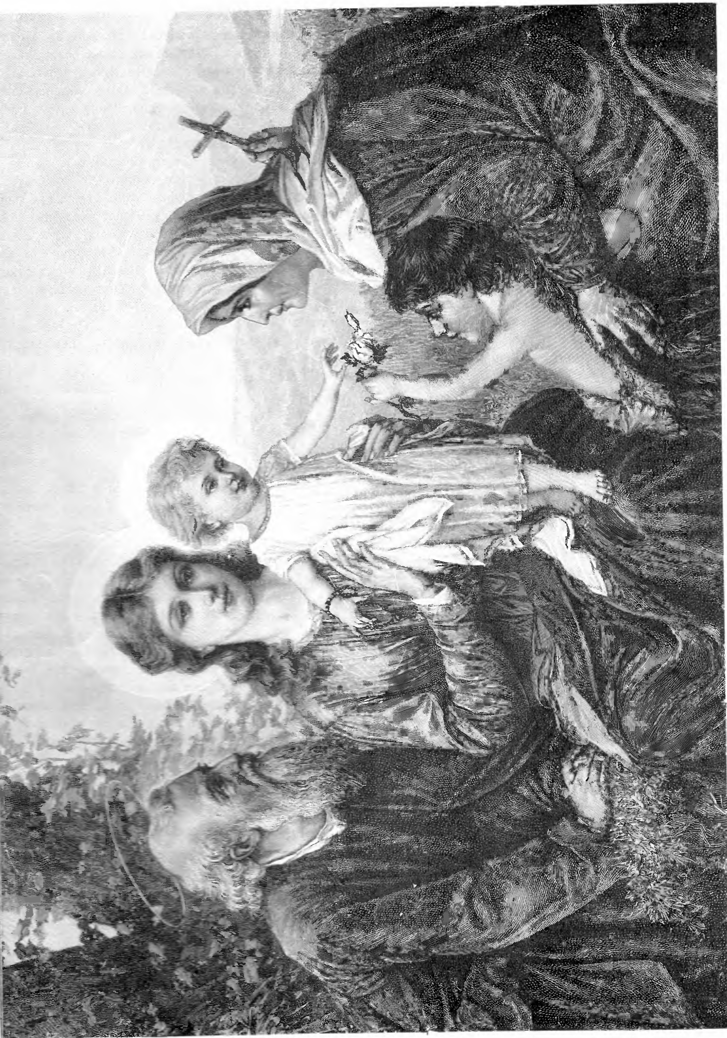
С В Я Т О Е С Е М Е Й С Т В О. (Рисунок Гофмана. — Къ стр. 15).